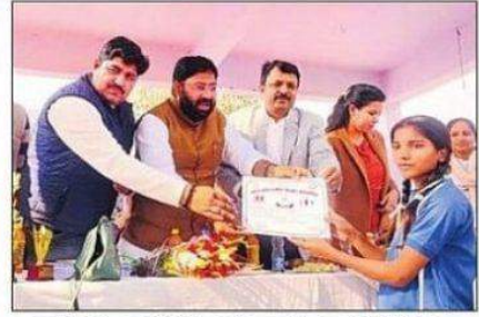
ग्रामीण खेलकूद में विजेता को सम्मानित करते अतिथि।