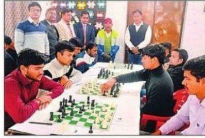
प्रतियोगिता में भाग लेते हुए खिलाड़ी।