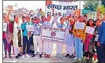
राष्ट्रीय सेवा योजना इकाई द्वारा निकाली गई स्वच्छता रैली में शामिल छात्राएं। संवाद

रैली में छात्राओं ने गंदगी को दूर भगाओ, चारों ओर स्वच्छता फैलाओ, हमने मन में ठाना है भारत को स्वच्छ बनाना है, दवाई से नाता तोड़ो स्वच्छता से नाता जोड़ो जैसे जागरूकता के नारे लगाकर ग्रामवासियों को जागरूक किया। रैली के दौरान गलियों में झाड़ू लगाकर गंदगी साफ की। साथ ही एनएच-91 स्थित यात्री टीन शेड और शहीद