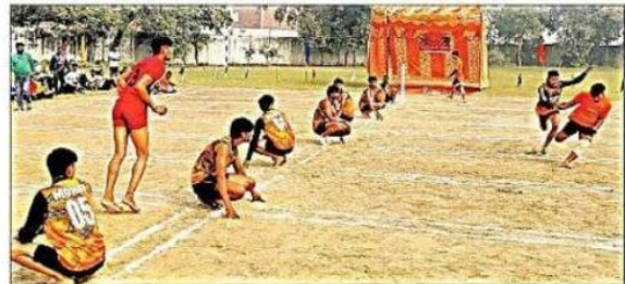
गुलावठी के डीएनपीजी कॉलेज में आयोजित अंतर महाविद्यालय खो-खो प्रतियोगिता में रापथ लेते खिलाड़ी और नाॅकआउट मैच में खो-खो खेलते खिलाड़ी।