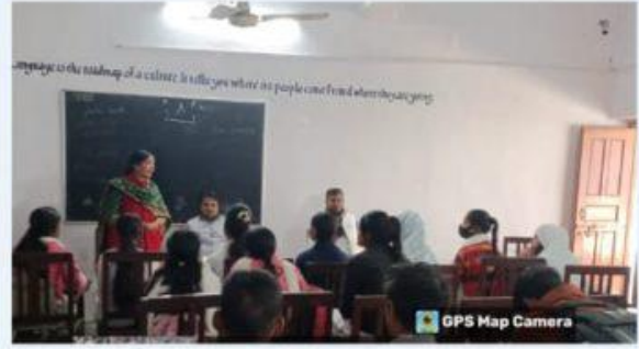
देवनागरी महाविद्यालय गुलावठी में विशिष्ट उपलब्धि प्राप्त महिला द्वारा व्याख्यान