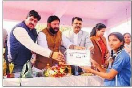
ग्रामीण खेलकूद में विजेता को सम्मानित करते अतिथि।